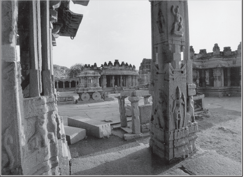
విట్టలస్వామి ఆలయం ప్రాంగణ దృశ్యం