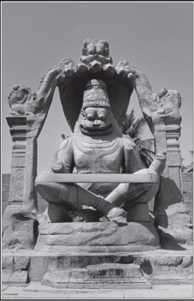
ఉగ్రనరసింహుని విగ్రహం (ప్రస్తుతం)