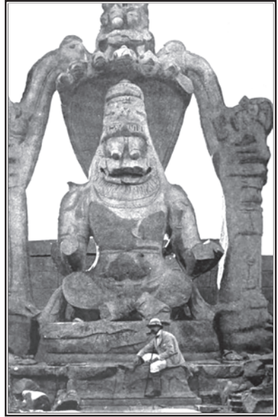
ఉగ్రనరసింహుని విగ్రహం (19వ శతాబ్దం)