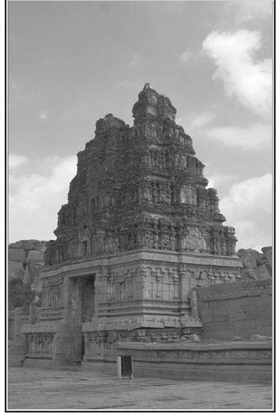
విట్టలస్వామి ఆలయ శిథిల గోపురం