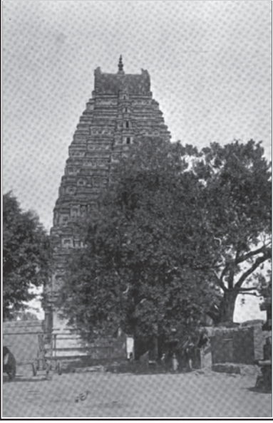
విరూపాక్షస్వామి ఆలయ గోపురం